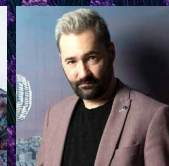
Christophe Dumaux CONTRATENOR (NATANAEL)