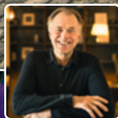
Thomas Hengelbrock DIRECTOR