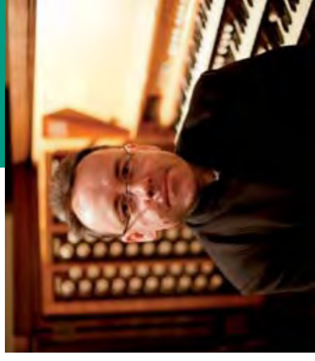
© Michael Hudson Amr El Etr

Los diversos conciertos ofrecidos por David Briggs en Bach Vermut y en las catedrales de León, Valencia y Zaragoza han cimentado a nivel nacional una fama de la que ya goza a ambos lados del Atlántico. Intérprete de sólida formación en la mejor tradición inglesa, amplió sus estudios en Francia asimilando su famosa escuela de improvisación. Para esta cita, Briggs acude con una serie de transcripciones que recorren diversas escuelas del XIX y el XX, además de una improvisación en la que mostrará su dominio de los diversos lenguajes organísticos.