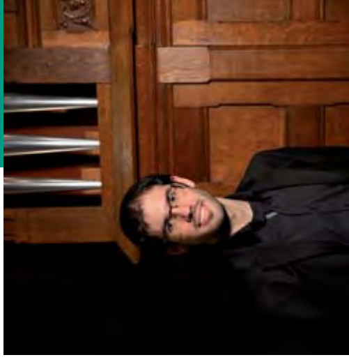
CICLOS DE ÓRGANO