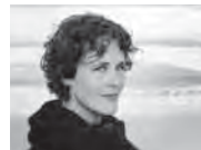
MARIANNE BEATE KIELLAND mezzosoprano